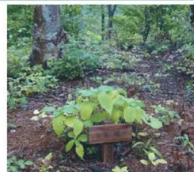
かつての樹木葬は山の中などにしかなかった。

かつての樹木葬は、山間部にしかありませんでした。墓石の代わりに樹木を植えることで、樹木一本一本を墓標とするものでした。ただ、樹木は年々成長し埋葬の場所がわかりにくくなり、お参りなどをする人から「どこに拜んだらいいかわからない」、「アクセスが悪い」などの問題があり、樹木葬を選ぶ人は多くありませんでした。