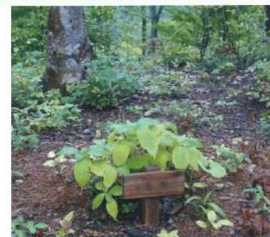
かつての樹木葬は山の中などにしかなかった。

かつての樹木葬は、山間部にしかありませんでした。墓石の代わりに樹木を植えることで、樹木一本一本を墓標とするものでした。ただ、樹木は年々成長し埋葬の場所がわかりにくくなり、お参りなどをする人から「どこに拜んだらいいかわからない」、「アクセスが悪い」などの問題があり、樹木葬を選ぶ人は多くありませんでした。