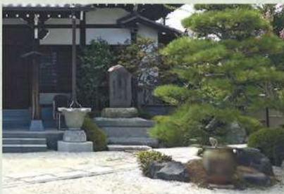
手入れの行き届いた苑内