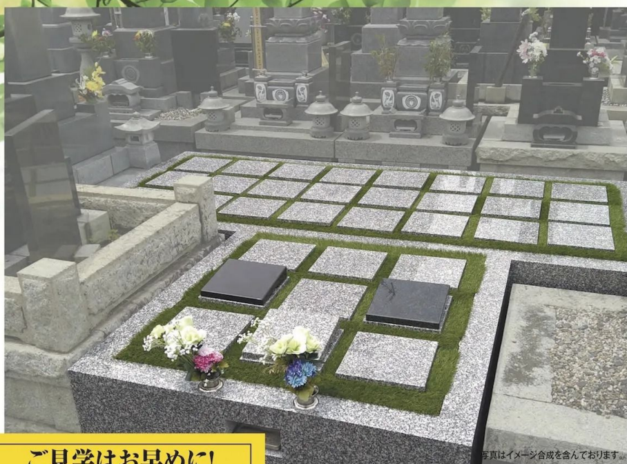
写真はイメージ合成を含んでおります。

時代とともにご供養の仕方が多様化しています。どんなに時代が変わろうとも変わらぬ故人への安らかな想い。コンパクトな樹木葬タイプの集合墓に祈りを込める。