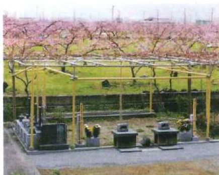
4月中旬には周囲の桃畑に桃の花が咲き乱れ、5月には藤が咲き1年を通して四季の移り変わりを豊かに映す