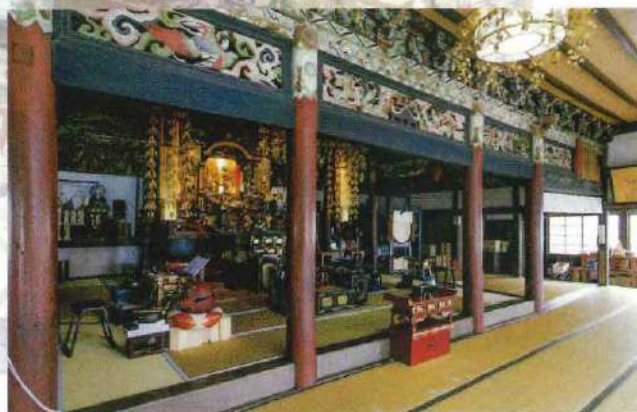
本堂 約450年前に創建され、火災や天災に遇うことなく阿弥陀如来本尊に見守られている

木葬がなかったからです」という方もいらっしやいました」と住職。自然と一体になるというイメージの良さに加えて、後継者がいない方、さまざまな事情を抱える方にも安心していただける自由さ。それが樹木葬の良さであり、注目が集まる理由だろう。 瑞蓮寺の樹木葬は、シエアリングの墓地（シエア墓）だ。高額な墓地の購入が必要なければ、墓地の継承を心配する必要もない。納骨の様式は地表面から15cm下の土中に直径30cmの底なし筒があり、その筒の中に遺骨を納めて土をかぶせるというもの。他の遺骨と混ざり合う心配もなく、故人の尊厳は保ちながら、遺骨は一人一人が筒の中で土に還る。樹木葬の名の通り、見渡す限りの桃畑が桃源郷となる春にはじまり、夏には藤棚と静けさと呼ぶその木漏れ日にもうっとり。水仙、彼岸花、山茶花など、四季折々さまざまな花が苑を彩る美しさも魅力だ。 「同じ想いの方が次々と訪れていつでも花とお線香を手向けてくれる」と住職。実際すでに面談の要望は多く、人々のニーズに合った時代が求める供養方法であることを証明している。現場の雰囲気を知りたい人は、ぜひ予約して住職の説明を聞いてみよう。