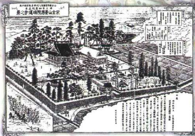
明治時代の古い全体図