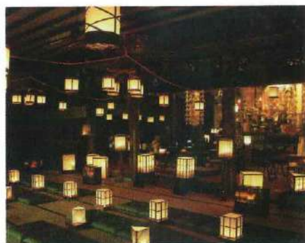
元禄時代から約300年続く「十夜法要」本堂内の様子。毎年11月第2土曜日19時半