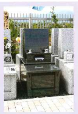
両隣と離れた「ゆとり墓地」0.75㎡