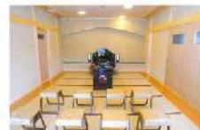
管理棟内の法要室

ご予算に合わせて、お求めやすい区画からゆとりのある大きな区画まで、自由にお選びいただけます。