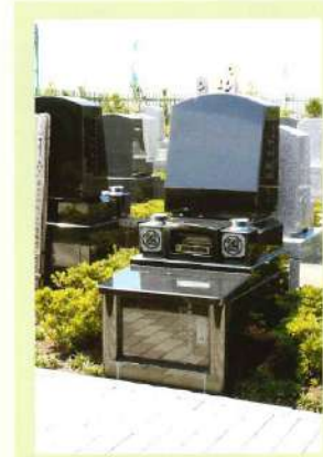
墓所の両隣を、サツキの花々と常緑の芝・クマリユウに包まれた墓地です。