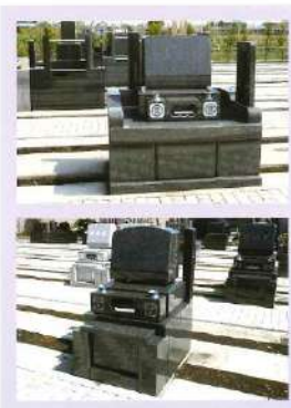
6タイプの面積からお選びいただける「一般墓地」