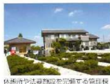
休憩所や法要施設を完備する管理棟