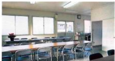
▲管理事務所(こちらでご休憩ができます。)