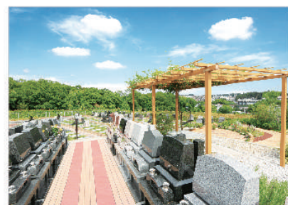
ゆとり設計で広々した参道

お墓の前の通路は車椅子同士がすれ違うほどの広さを実現。広さは贅沢な1.5m幅です。