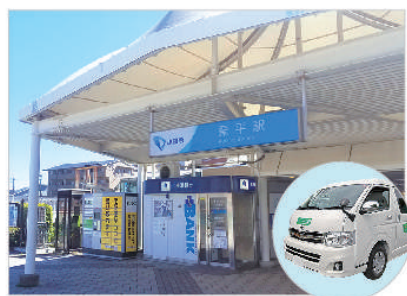
駅からのアクセス良好

最寄り駅の栗平駅から徒歩9分の好立地。送迎バスも完全予約制なので待ち時間なしでお迎えに参ります。