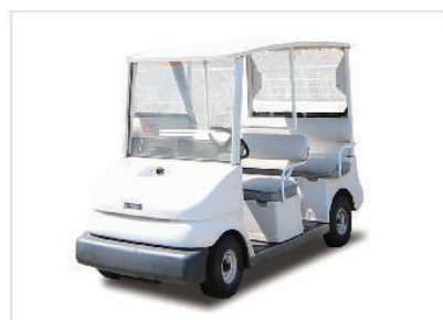
電動カートで園内移動可能

最寄り駅の栗平駅から徒歩9分の好立地。送迎バスも完全予約制なので待ち時間なしでお迎えに参ります。