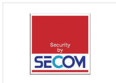
セキュリティー搭載

川崎清風霊園では全てお墓に免震ゲルを施工し、大切なお墓を地震からお守り致します。