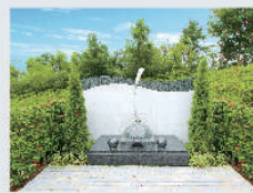
永代供養合祀墓所 清風の碑「想の記」