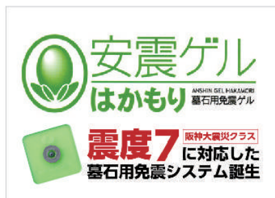
墓石は免震設計で安心

墓域の近くまで乗り付けられる駐車場を完備。各駐車場には水場も併設されております。