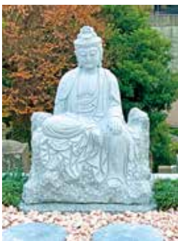
今回の観音様は、慶珊寺 十一面観音半跏像 (神奈川県指定重要文化財) をモチーフに制作。

※別途墓石代金がかかります。 ※護持費(管理費)：50年分一括払い150,000円