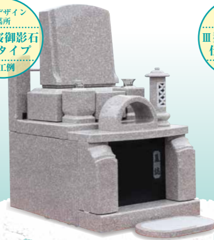
洋型デザイン墓所 III型 緑御影石仕様タイプ 施工例