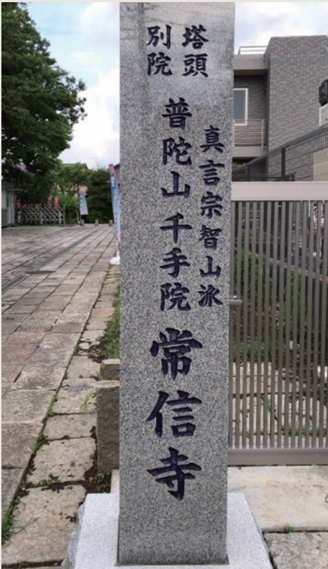
● 塔頭別院 常信寺の山号碑