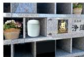
▲地上の納骨壇に骨壺のまま安置し石の銘板で蓋をします。