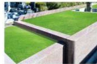
▲シンボルツリーの桜のもと、自然に還るお墓です。