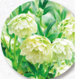
クリスマスローズ