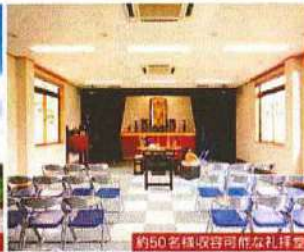
約50名様収容可能な礼拝堂