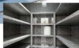
▲納骨壇に骨壺のまま安置します。