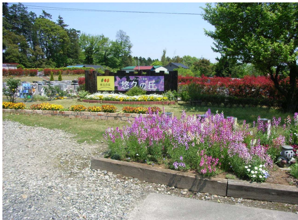
霊園エントランス