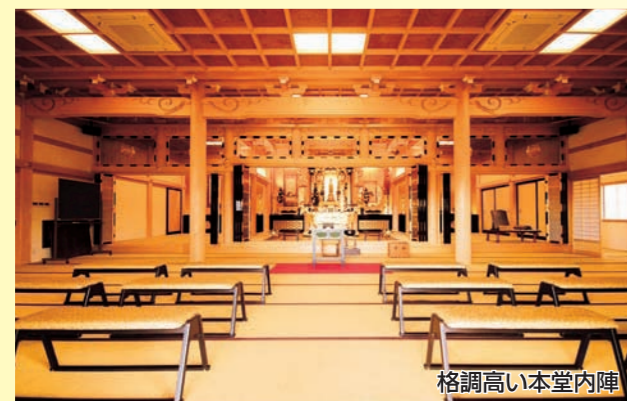
格調高い本堂内陣