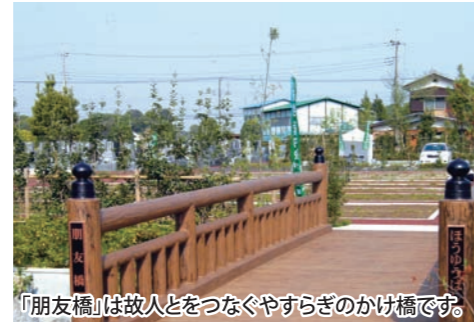
「朋友橋」は故人とをつなぐやすらぎのかけ橋です。