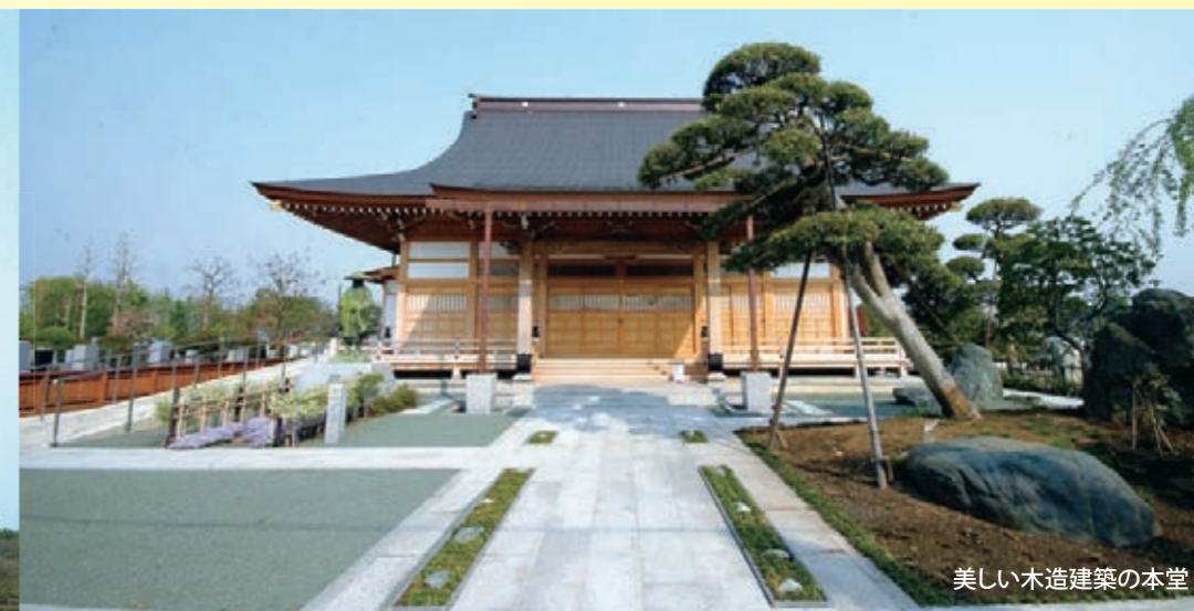
美しい木造建築の本堂