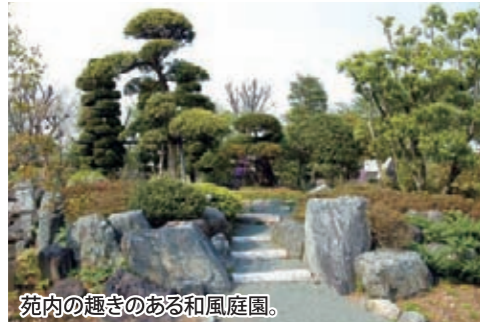
苑内の趣きのある和風庭園。