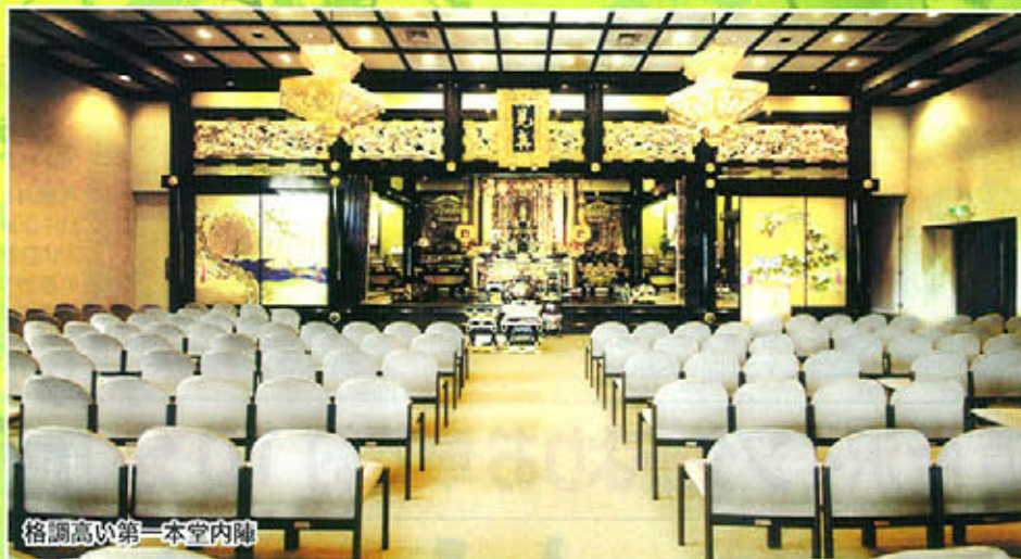
格調高い第一本堂内陣

格調高い本堂をはじめ、礼拝堂も併設する預骨室などの充実の設備は、伝統ある寺院ならではの。ご法要からご会食まで、安心してご供養いただける設備が整っております。