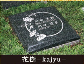
花樹 - kajyu -