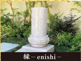
縁 - enishi -