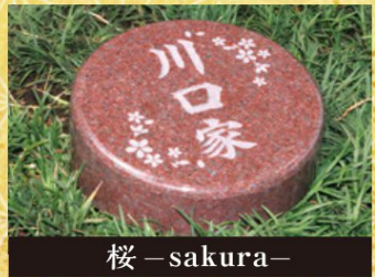
桜 - sakura -