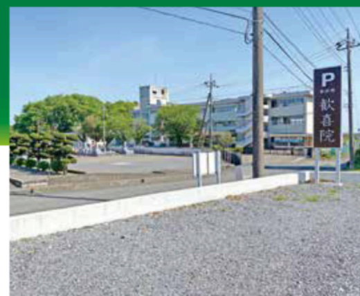
●大型駐車場がございます。