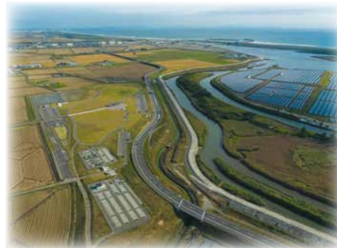
南側から関上地区を望む