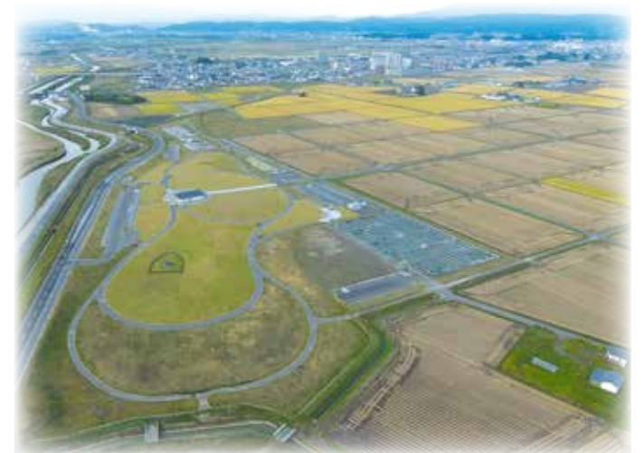
北側から美田園地区中心部を望む